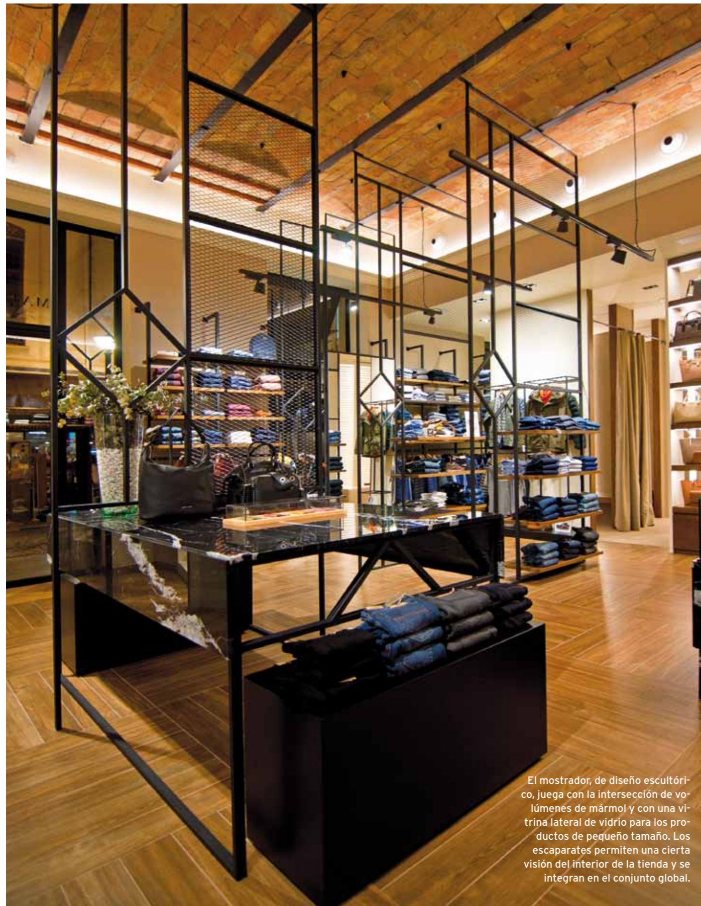
El mostrador, de diseño escultórico, juega con la intersección de volúmenes de mármol y con una vitrina lateral de vidrio para los productos de pequeño tamaño. Los escaparates permiten una cierta visión del interior de la tienda y se integran en el conjunto global.