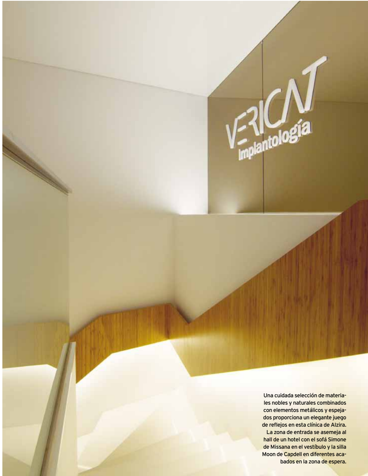
Una cuidada selección de materiales nobles y naturales combinados con elementos metálicos y espejados proporciona un elegante juego de reflejos en esta clínica de Alzira. La zona de entrada se asemeja al hall de un hotel con el sofá Simone de Missana en el vestíbulo y la silla Moon de Capdell en diferentes acabados en la zona de espera.